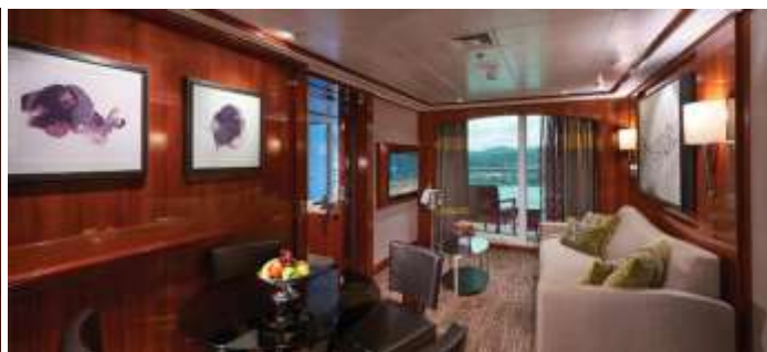
The Haven Courtyard Penthouse with Balcony / DECKS 14 / LOCATION MID / Size: 440 sq. ft.