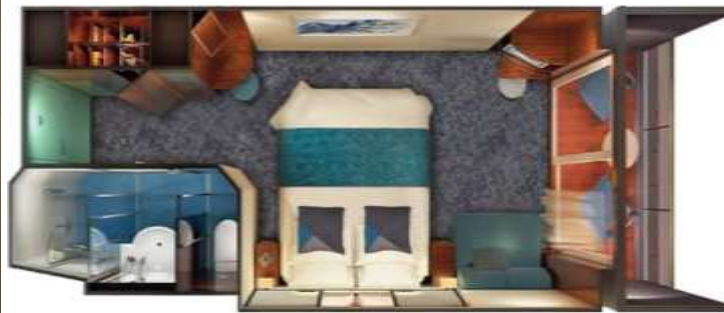
Balcony / DECKS 10,9,8 / LOCATION FORWARD, AFT FORWARD / Size: 272 – 285 sq. ft.