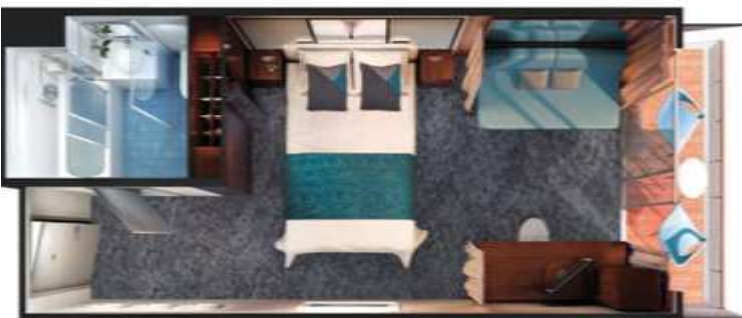
Mini-Suite with Balcony / DECKS 11 / LOCATION FORWARD, AFT