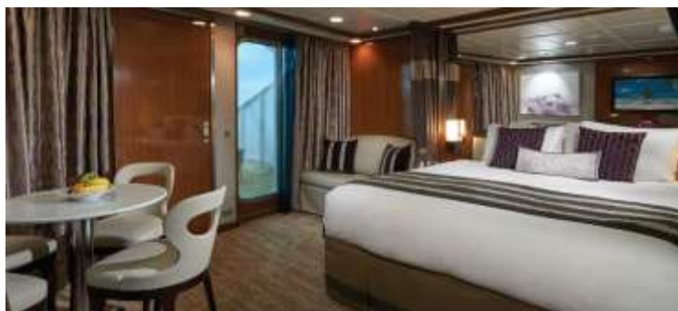
Penthouse with Large Balcony / DECKS 8,9,10 / LOCATION AFT / Size: 341-387 sq. ft.