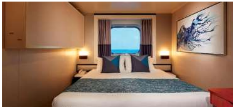
Sail Away Oceanview / DECKS 4,5,8 / LOCATION FORWARD, MID, AFT / Size: 155 sq. ft.