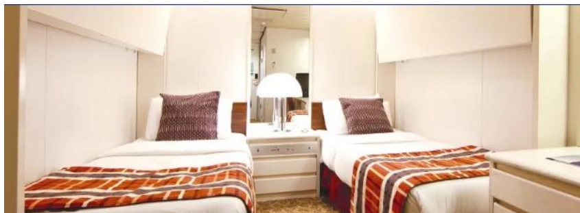
Interior cabin Category L (Decks 5, 6, 9)