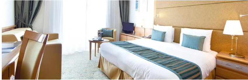
Junior Suite con Terraza cabin Category J, T (Decks 10, 11)

ข้อแนะนำ ควรเลือกเที่ยวบิน ที่ไปถึงสนามบินฯ ล่วงหน้าก่อนเวลาเช็คอินขึ้นเรือ ประมาณ 3 ชั่วโมงขึ้นไป