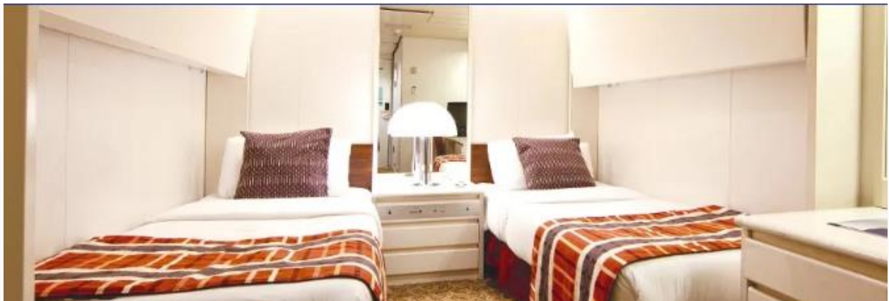
Interior cabin Category L (Decks 5,6,9)

ชนิดและประเภทห้องพัก บนเรือ Pullmantur Horizon