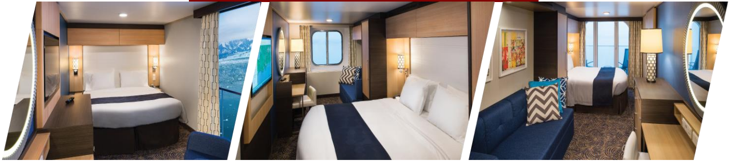
ห้องแบบไม่มีหน้าต่าง