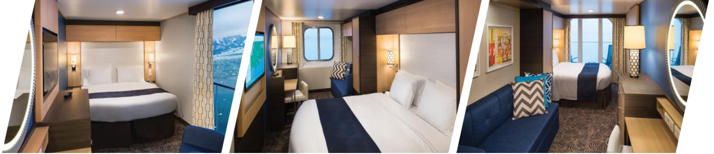
ห้องแบบไม่มีหน้าต่าง