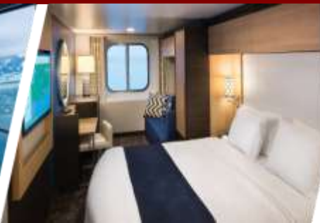
ห้องแบบมีหน้าต่าง