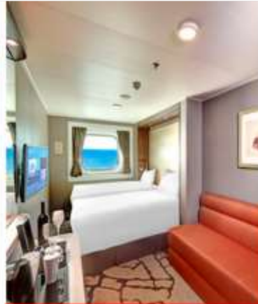
Oceanview Stateroom with Window 84 Staterooms from 16 sq.m – 35 sq.m