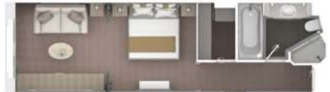
Vista Suite One bedroom: 31 m 2