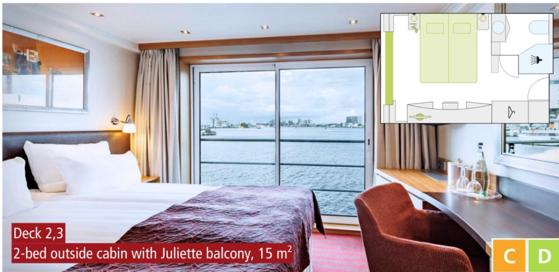
Deck 2,3 2-bed outside cabin with Juliette balcony, 15 m 2