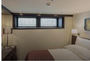
Deluxe Stateroom (CATEGORY E & D) - 172 SQ FT