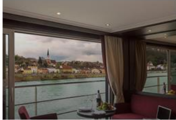
Panorama Suite (CAT. A,B,P) - 200 SQ FT