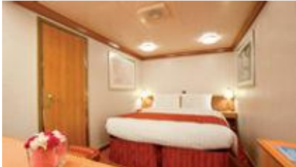
inside ห้องไม่มีหน้าต่างด้านใน