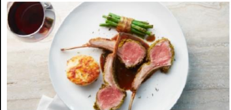
The Haven Restaurant

Exclusively for guests of The Haven. Seating capacity: 98