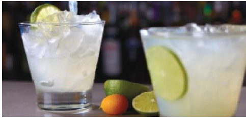
The A-List Bar

The perfect spot to, sip a handcrafted cocktail and enjoy the panoramic views from inside The Manhattan Room. Seating capacity: 20