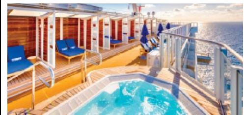
Vibe Beach Club

An adults-only private retreat with stunning views, oversized hot tub and full-service bar. Seating capacity: 00