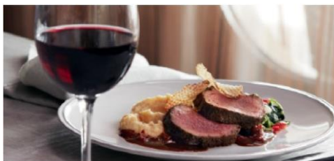
The Manha/tan Room