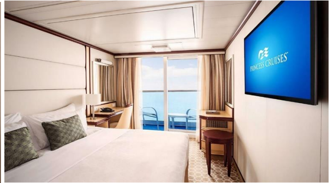
Balcony ห้องมีระเบียง