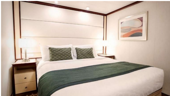
Interior ห้องไม่มีหน้าต่าง