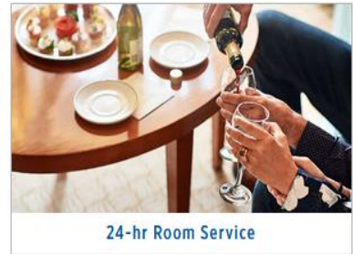
24-hr Room Service