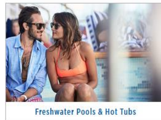
Freshwater Pools & Hot Tubs