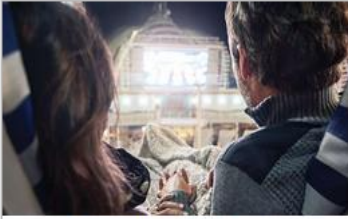
Movies Under the Stars®