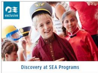
Discovery at SEA Programs