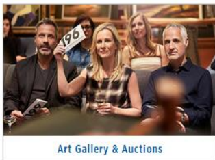
Art Gallery & Auctions