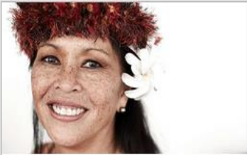
Festivals of the World