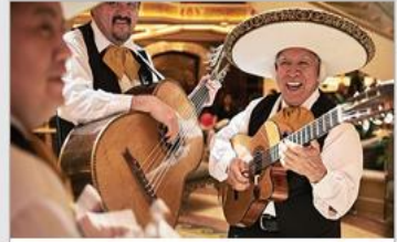
Music & Dancing