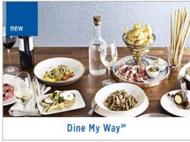
Dine My Way SM