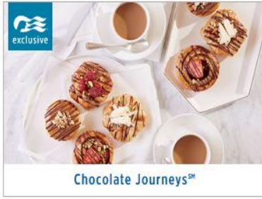
Chocolate Journeys SM