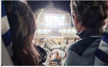
Movies Under the Stars®