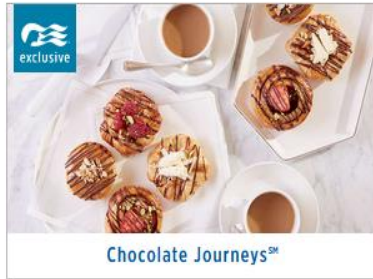
Chocolate Journeys SM