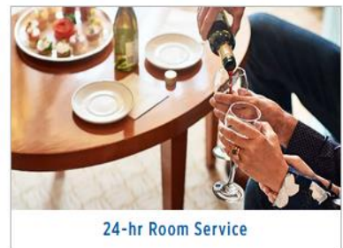
24-hr Room Service