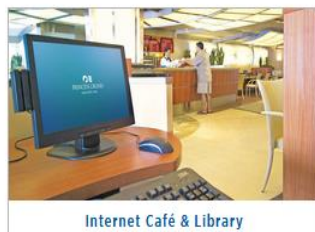
Internet Café & Library