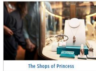
The Shops of Princess