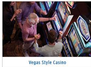
Vegas Style Casino