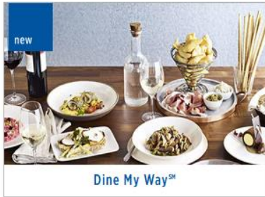
Dine My Way SM