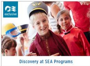
Discovery at SEA Programs