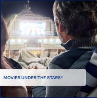
MOVIES UNDER THE STARS®