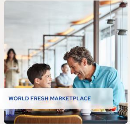
WORLD FRESH MARKETPLACE