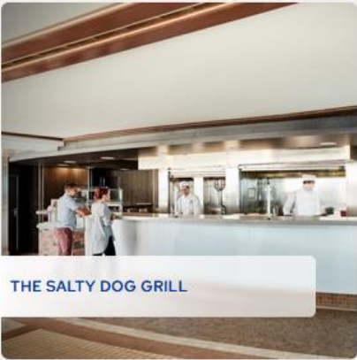
THE SALTY DOG GRILL