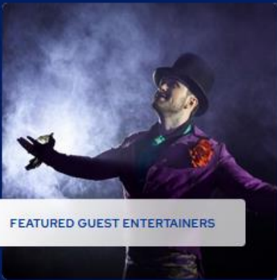
FEATURED GUEST ENTERTAINERS