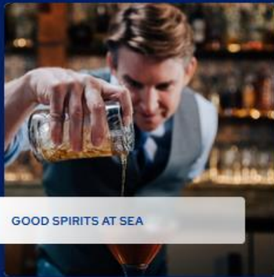
GOOD SPIRITS AT SEA