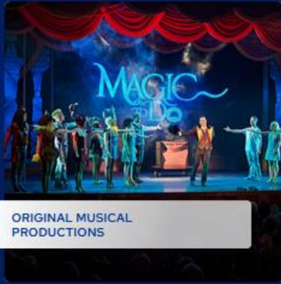
ORIGINAL MUSICAL PRODUCTIONS