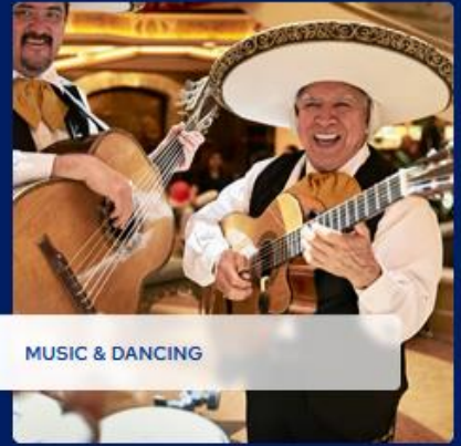
MUSIC & DANCING