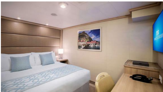
ห้องพักแบบมีหน้าต่าง (Premium Oceanview)