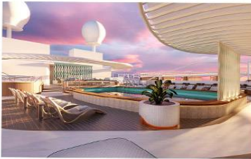
Signature Sun Deck

Introducing the Signature Collection, exclusively on Sun Princess®. In addition to premium stateroom amenities, Signature Collection Suites include access to the Signature Restaurant, Signature Lounge and private Signature Sun Deck, a private area of the Sanctuary.