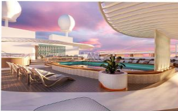
Signature Sun Deck

Introducing the Signature Collection, exclusively on Sun Princess®. In addition to premium stateroom amenities, Signature Collection Suites include access to the Signature Restaurant, Signature Lounge and private Signature Sun Deck, a private area of the Sanctuary.