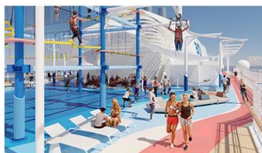
Sea Breeze Rollglider® and The Net Ropes Course