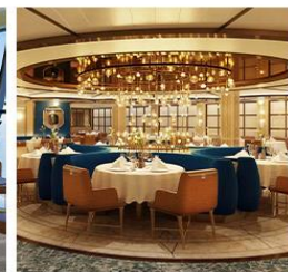
Sabatini's Italian Trattoria