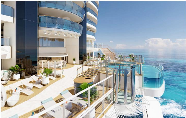
Wake View Terrace