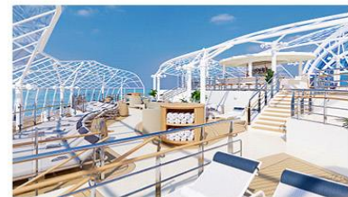
Sea View Terrace