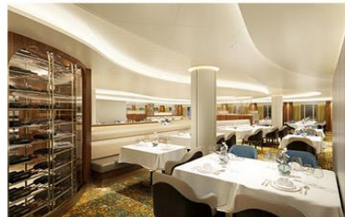
Reserve Collection Restaurant