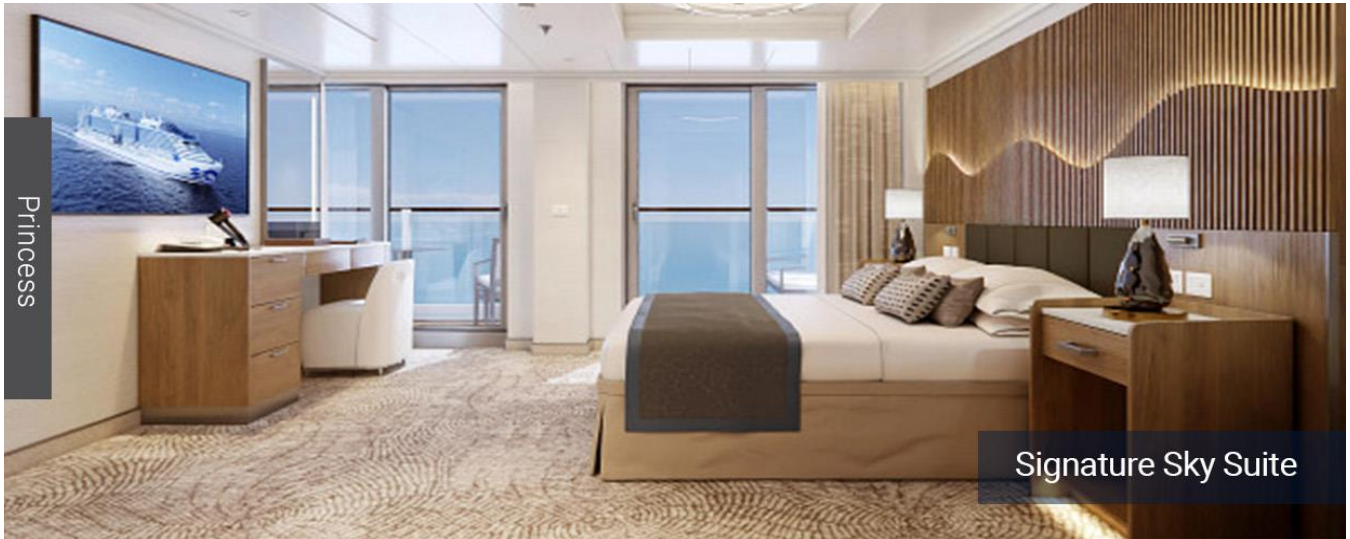
Signature Sky Suite