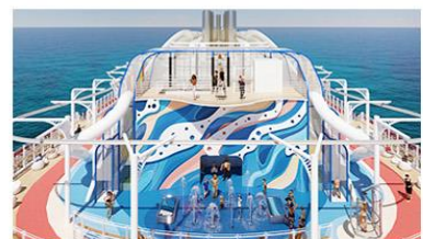
Coastal Climb, Splash Pad & The Lookout