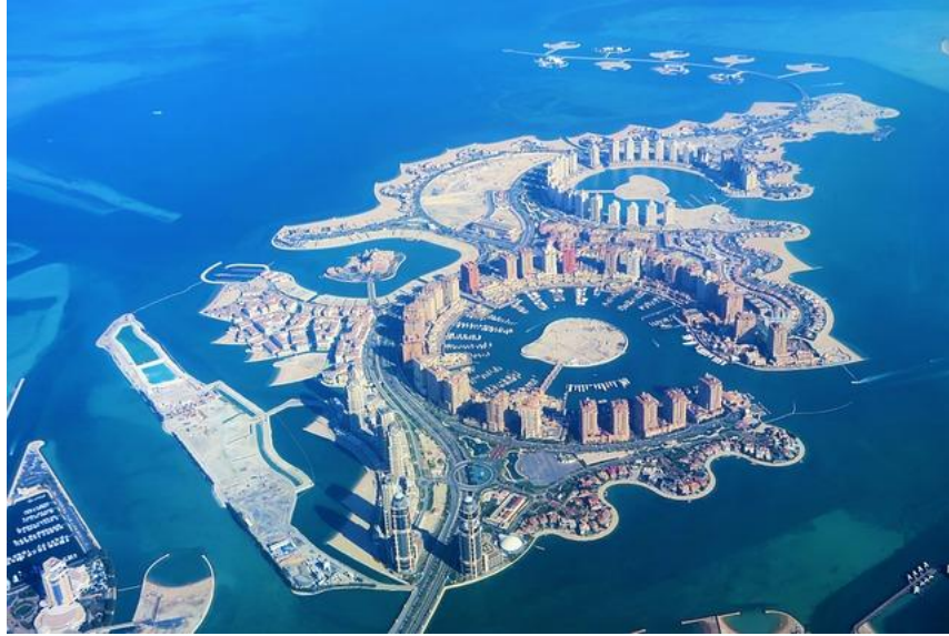
The Pearl Qatar

ทุกท่านสามารถได้รับความสนุกสนานและเพลินเพลินอย่างเต็มที่ได้จาก กิจกรรมที่จัดขึ้นตั้งแต่เช้าจรดค่ำ ไม่ว่าจะเป็นกิจกรรมการออกกำลังกายตอนเช้า, อาหารเช้าที่ห้องอาหารบุฟเฟต์, โชว์การแสดงสดตลอดทั้งวัน ไม่ว่าจะเป็นดนตรีสดในบาร์ หรือห้องอาหารต่างๆ โดฮา เมืองหลวงของกาตาร์ เป็นเมืองที่มีทั้งความทันสมัยและวัฒนธรรมอันยาวนาน โดฮาขึ้นชื่อเรื่องสถาปัตยกรรมอันโดดเด่น พิพิธภัณฑ์ที่น่าสนใจ ตลาดที่คึกคัก และชายหาดที่สวยงาม