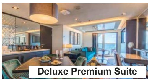
Deluxe Premium Suite