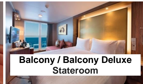
Balcony / Balcony Deluxe Stateroom