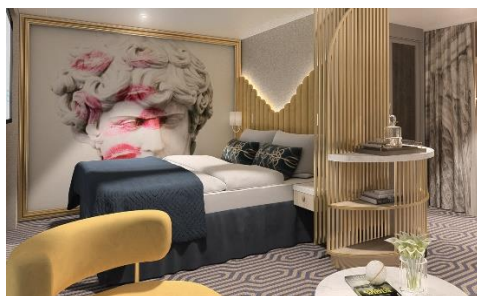
<--- Palace Deluxe Suite

เพื่อประโยชน์ของผู้เดินทาง โปรดศึกษาเงื่อนไขการจองทัวร์ และการยกเลิกทัวร์ ที่ระบุในรายการทั้งหมด หลังจากท่านทำการจองทัวร์แล้ว ทางบริษัทจะถือว่าท่านเข้าใจ และพร้อมปฏิบัติตามเงื่อนไขดังกล่าว