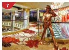
7 Johnnie Walker House™ Immerse yourself in the intricate world of premium Scotch whisky.