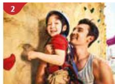
2 Rock Climbing Wall Challenge yourself on our mountainous rock climbing wall.