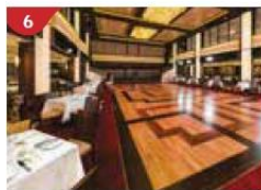
6 Dream Dining Room Savour a wide variety of Asian and international cuisine.