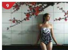
9 Crystal Life™ Spa Rejuvenate mind, body and soul with our holistic Western and Asian spa experience.