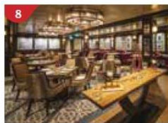
8 Bistro By Mark Best Relish contemporary Western cuisine from the internationally-acclaimed Australian chef.