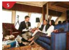
5 The Palace Indulge in European-style butler service and exclusive facilities.