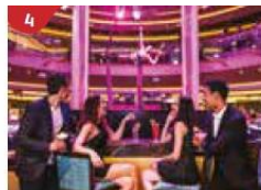
4 Bar 360 Catch live music and aerial acrobatic performances with a glass of champagne.