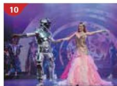
10 Zodiac Theatre Enjoy live production shows from the acclaimed award-winning entertainment team.