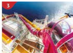
3 Waterslide Park Get drenched in fun on one of our six different waterslides.