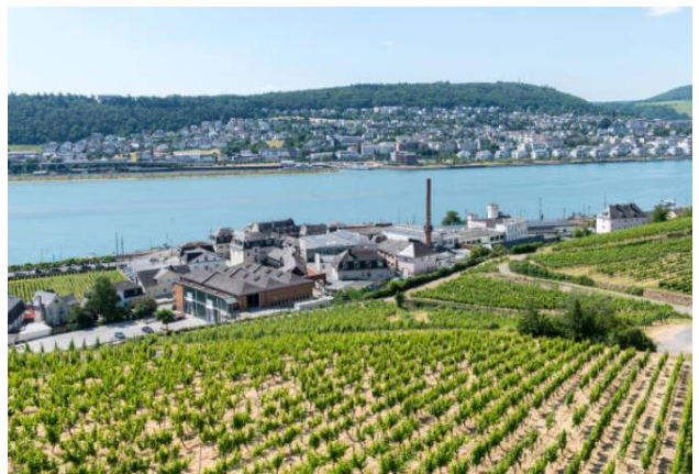
รายการทัวร์ที่น่าสนใจ เที่ยวชมปราสาททอรัรัต และชิมไวน์