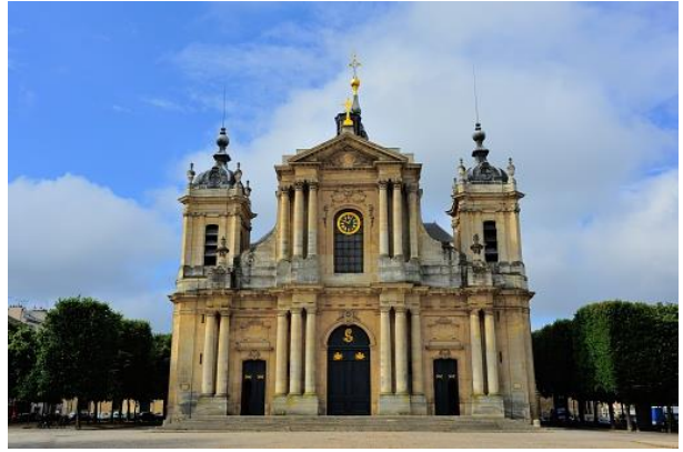
รายการทัวร์ที่น่าสนใจ ชมพระราชวังแวร์ซาย อพาร์ทเมนต์แห่งความลับ